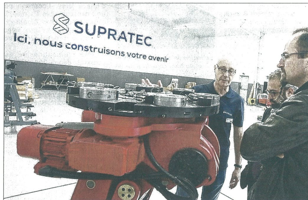
Hier, clients, partenaires et élus ont pu apprécier le savoir-faire de la société Supratec Lormac.