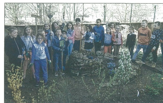
Les petits jardiniers de l'association Natalie reprennent leurs activités avec le printemps.

Les inscriptions sont en cours pour les familles avec l'arrivée des vacances scolaires de printemps. Le centre de loisirs tucquenois, organisé par l'association Natalie, fonctionnera du lundi 10 avril au vendredi 21 avril, accueillant des enfants de 3 à 11 ans. A la Maison des Droits de l'Enfant, quartier du village de Mercredi 12 avril, grand jeu de