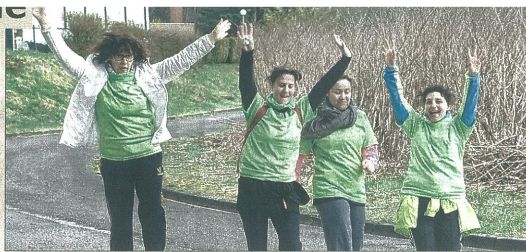
L'Audunoise, une marche-course sans chrono, où la solidarité, la convivialité et la bonne humeur sont toujours de mise.