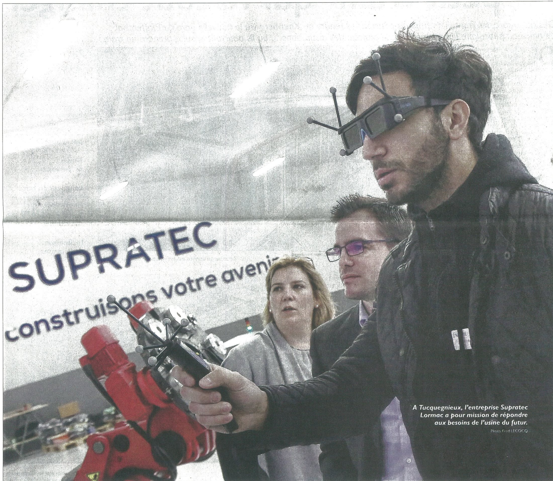
A Tucquegnieux, l'entreprise Supratec Lormac a pour mission de répondre aux besoins de l'usine du futur.