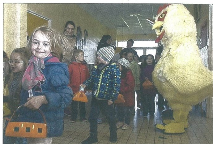
Les enfants trépignaient dans le couloir en attendant l'arrivée du lapin de Pâques. Heureusement que le poussin était déjà là...

Après quelques directives, les portes se sont ouvertes et les enfants se sont précipités dans la cour de récréation, là où étaient cachés les œufs en plastique. Les bambins couraient dans tous les sens, en respectant les règles du jeu sinon ils devaient recommencer. Il fallait absolument trouver les œufs de la bonne couleur. De temps en temps, les écoliers faisaient une pause pour faire un câlin au lapin ou au poussin de Pâques. Après avoir ramassé tous les